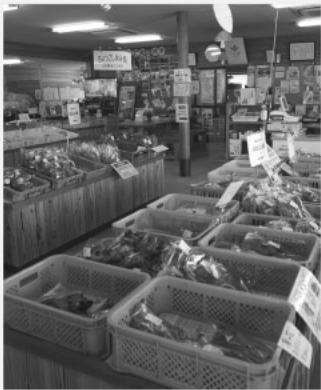
ぶなの里に集まる地元野菜

地産地消の要である学校給食の地元産自給率は21.2%であり、あまりにも低く問題であるが、考えを問う。