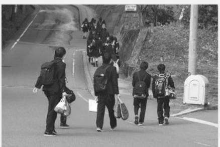
高校生の登校風景

提案の趣旨、思いはよく分かるが、高校生への支援がどこら辺りの状況にあるかという視点も必要である。将来的な課題としたい。