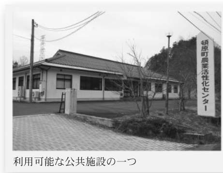
利用可能な公共施設の一つ

衣掛団地には、若者用の住宅も考えているので、その中で検討したい。公共施設は大いに利用して欲しい。