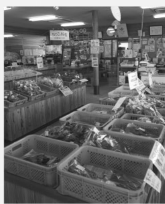
ぶなの里に集まる地元野菜

地産地消の要である学校給食の地元産自給率は21.2%であり、あまりにも低く問題であるが、考えを問う。