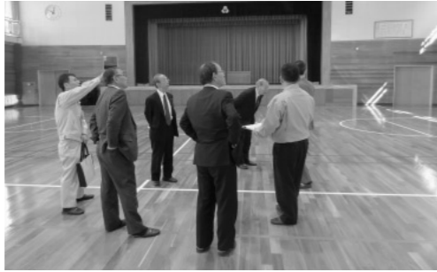
大改修を終えた赤名小学校体育館を視察