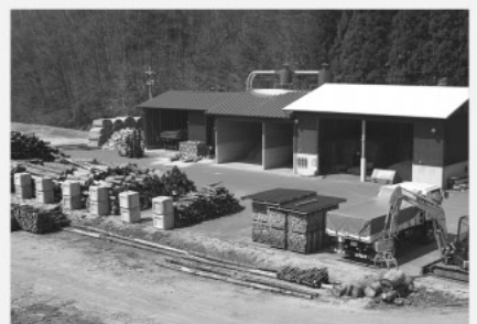
飯南町バイオマスセンター

敷料用オガコの含水率が高い点は、森林組合と問題意識を共有し協議している。敷地の拡張から具体的な検討を進めたい。