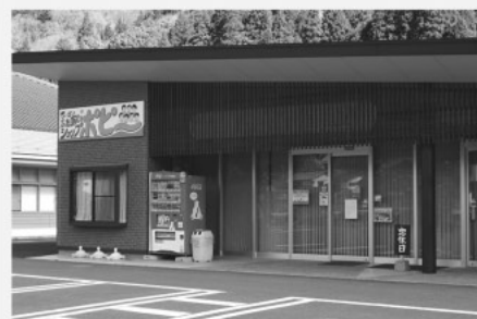
閉店したスーパー

志々地区の組織「わっしょい志々会」で検討されている。地域の実情やニーズが変化していく中で、状況に適切する対策を地域の皆さんと考え、取り組んでいきたい。