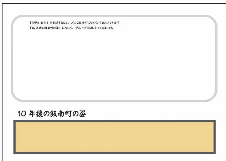
テーマ1 検討シート 10年後の飯南町の姿