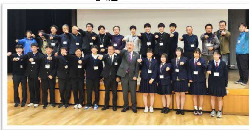
令和5年12月1日 来島地区