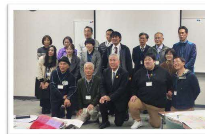
令和5年11月29日 頓原地区