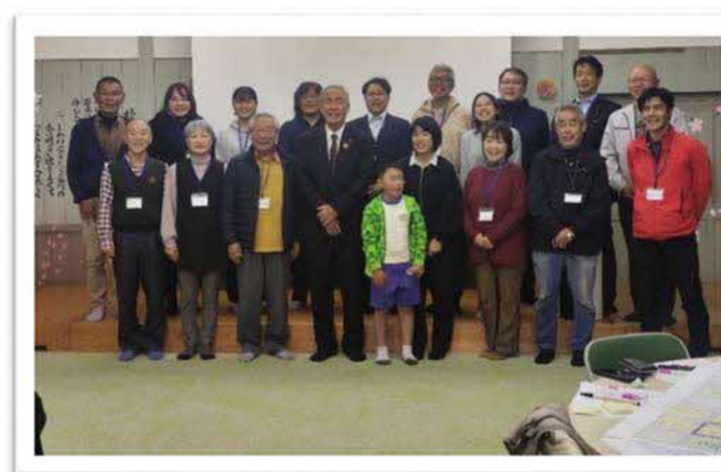
令和5年11月27日 谷地区