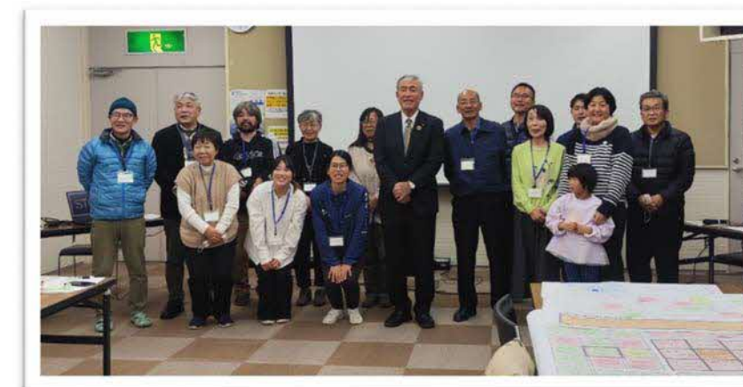
令和5年12月8日 赤名地区