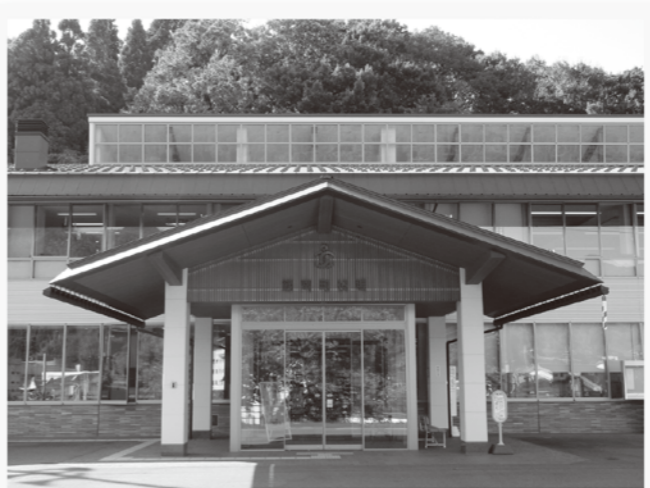
飯南町役場本庁舎

飯南町は「生命地域」を理念として誕生した。この理念は将来に向けても大切な。行政施策においては、新しい時代に即した視点、切り口で練り直しも必要だが、これまで築いてきたまちづくりの本質を理解する人が望ましい。