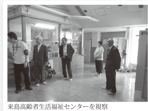
来島高齢者生活福祉センターを視察

昨年より保育士を確保するため修学助成を実施している。(2年就学2名が、4年就学1名になり、1名分の入学金が不要となった)