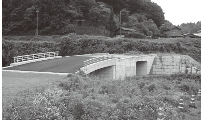
町道角井境線（未完成）