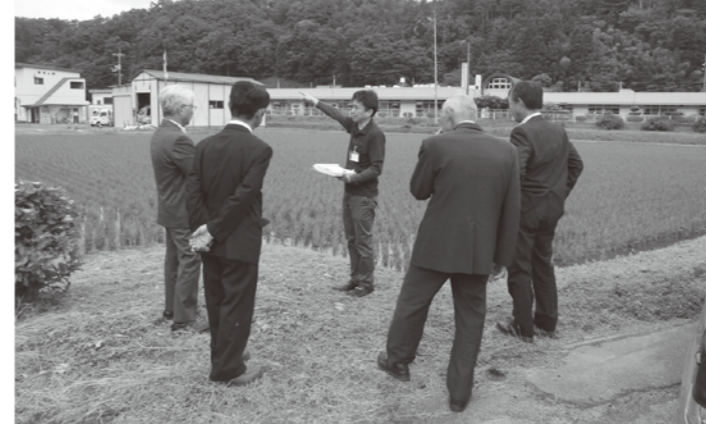
晴雲の里移転予定地を視察