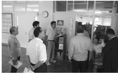
赤名小学校の大規模改修完了視察