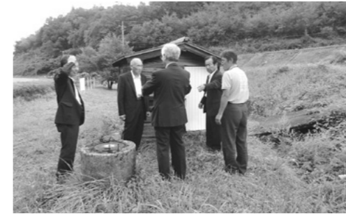
頓原ラムネ温泉湯元の現状視察