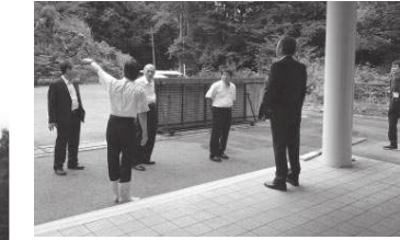
町の斎場施設視察