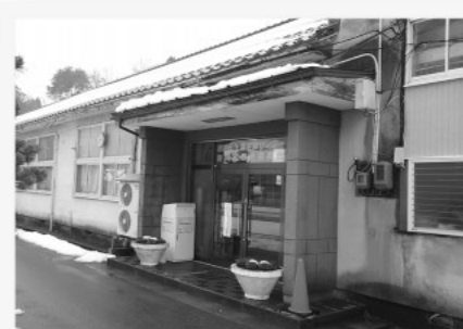
生涯学習センター