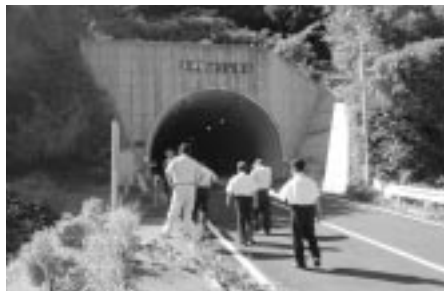
教育経済常任委員会 佐田八神線視察