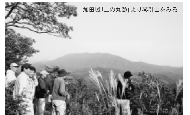
加田城「二の丸跡」より琴引山をみる