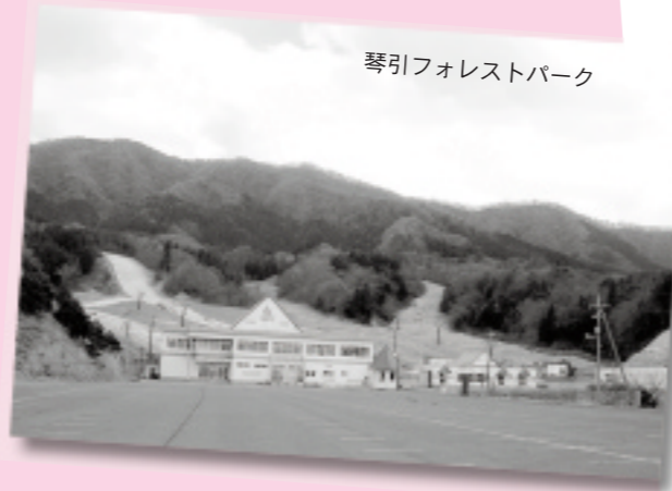
琴引フォレストパーク

従って、当委員会としては、先行きに大きな不安要素を抱えるスキー場については、来シーズンまでに閉鎖する考えで取り組むべきであるとの認識が大勢となっています。以上、これまでの審議を経て、3月定例会において取り急ぎ対応が必要と考えられる第三セクター「琴引フォレストパーク」に関わる中間報告を行いました。