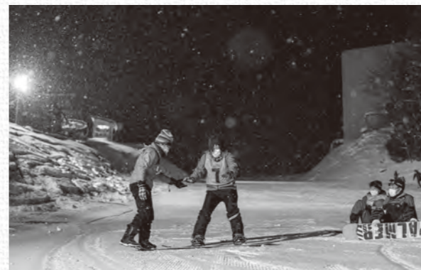
スノーボード経験者が初挑戦の参加者に教える姿も