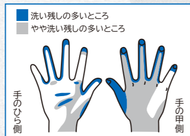
（手洗いで減らせるウイルスの数を見よう）