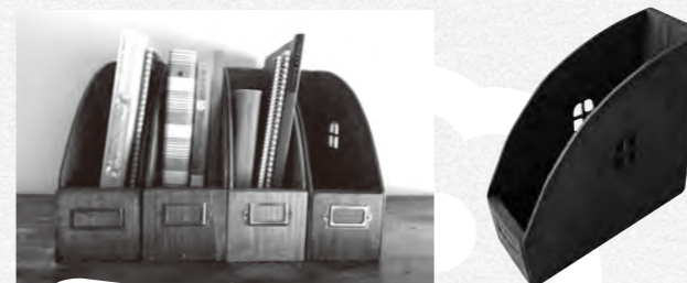
※1.木のファイルボックスは、好きな形にカットして作ります

今年も「ふれあい講座」の季節がやってきました。縦走コースを中心とした季節の山歩きのほか、家族で楽しめる自然体験・木工体験もあります。ぜひお出かけください。