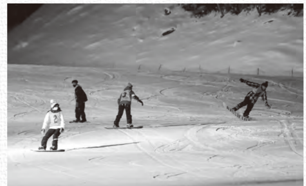
ぶつかりそうで、ぶつからない。ゲレンデには笑い声が