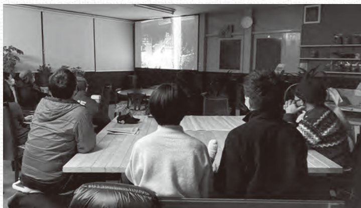
約85年前の来島の暮らしを記録した映像や、アメリカのコメディ作品が上映