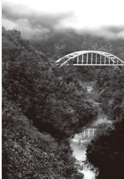
風景部門(部門賞)「晩秋の朝」金崎操(出雲市)