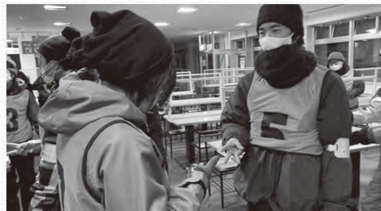
指の数を合計5にする「じゃんけんファイブ」で交流

スキー・スノーボードを楽しもう 友達づくりツアー 夜の琴引フォレストパークスキー場で「友達づくりツアー」が開催されました(町内5公民館の共催)。 当日は、町内に住んでいる若者や町内で働いている若者など21人が参加。じゃんけん遊びと準備運動で体を温めた後、貸し切りのゲレンデに飛び出し、スキーとスノーボードを楽しみました。 参加者は「顔は見たことあるけど、話したことがない人と話せてよかったです」などと話していました。