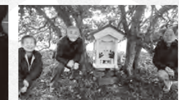
高校生を指導した大工さん・庭師さんと完成した「乙女社」