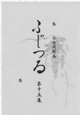
歌集「ふじつる」には小中高生の短歌も掲載