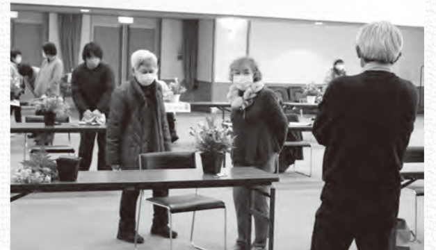
完成した作品は十人十色。最後はみんなで作品を鑑賞しました

一足先に春気分 フラワーアレンジメント教室 今年で6回目になる「フラワーアレンジメント教室」が赤名農村環境改善センターで開催されました(赤名公民館主催)。