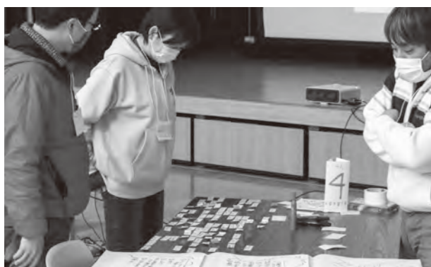
架空の人物の名前や性別、年齢、仕事、趣味などを設定。似顔絵も描きました