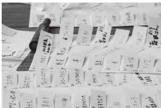
各テーブルには、1回目の参加者が書き出した「まちの魅力」がびっしり