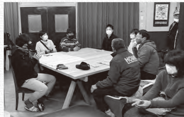
「貴重な映像を見られたし、いろんな人と話せてよかった」との声も

古きを知り、未来を創る 活動映画試写会 昔の暮らしや娯楽を知る「活動映画試写会」が、里山研究室(野萱)で開催されました。