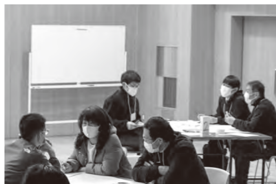
「まちの魅力」を使って、架空の人物が希望や野望を実現する物語づくり