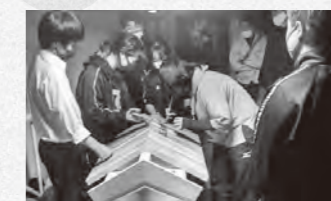
慣れない社づくりに奮闘する飯南高校生

飯南高校生と一緒に、志々地区八福神「乙女社」の社を建て直し、年末に新しい社を納めました。高校生のアイデアで、乙女社の周辺の木を使ったストラップも手作りました。来年度も高校生と地域の皆さんの交流ができればと思います。