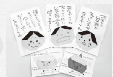
かわいい折り紙と温かいメッセージを添えたハガキ

ちが作った折り紙を張った「ハガキ」を送りました。コロナの感染拡大が早く収まり、地域の皆さんの顔を見ながら話したり、活動したりできるのを楽しみにしています。