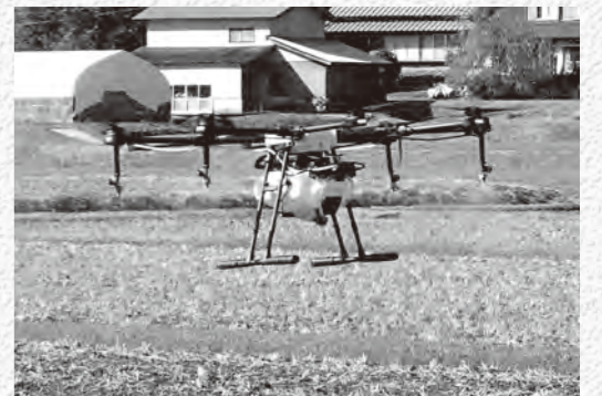
(一社)ファームアシスト飯南で使用している防除用ドローン

りだいが年上ですが、全てを兼ね 備えていてかっこいいんです。知 力、体力共に不足している私です が、いつか先輩たちみたいにかっこ よくなれるように頑張っていきた いと思います。