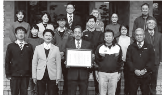
教員が丸となって学習方法を研究しました

頓原中学校が「優れた教育活動表彰」を受賞しました。同校は「GIGAスクール構想」に基づき、ICT機器(タブレット端末等)を活用した学習システムを構築。その実績をもとに、町教育研究会メディア部会を索引し、他校の模範となる教育活動を進めている点が評価されました。この表彰は、島根県が教育の振興を目的に実施。教育・スポーツ・文化活動に携わる教職員や団体、学校の優れた活動に贈られます。