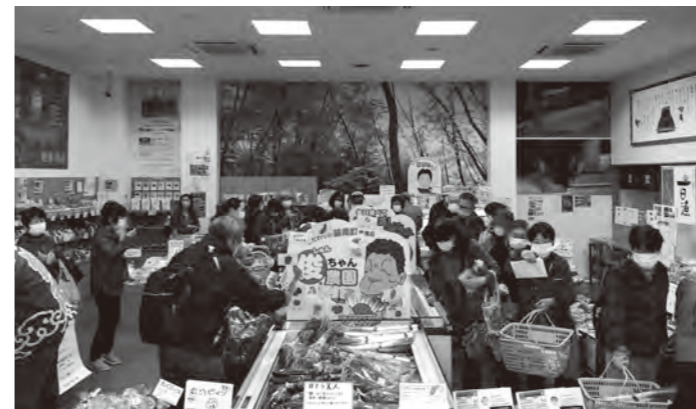
早朝からにぎわう店内

10月30日、三次市にある飯南町アテナショップいまるシエで「8周年記念イベント」を開催しました。当日は「特産品が当たる大抽選会」「きのこの詰め放題」「りんご詰め放題」「芋まつり」などの催しを開催。開店と同時に多くの人が来場し、大盛況となりました。このイベントは、飯南町の質のよい農産物や特産品、観光施設等を町外の多くの人に知ってもらい、町内農産物の売上向上や観光客の増加につなげることを目的に開催しています。