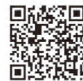
しまねのふるさと年賀状 ホームページ