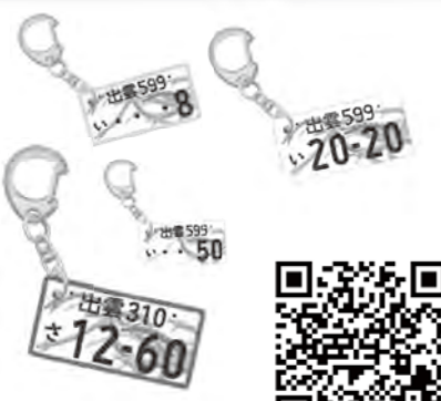
詳細はこちらから

●内容 ①お持ちの車のナンバープレートがキーホルダーなる「オリジナルホルダープレゼントキャンペーン」(抽選で毎月50人)、②飯南町・出雲市を巡って特産品が当たる「デジタルスタンプラリーキャンペーン」(抽選で合計40人) ●応募資格 出雲版図柄入りナンバープレート取得者・申込者 ●応募方法 ①インターネットの応募専用フォーム、②応募用紙(役場本庁舎・各支所、出雲市役所ホームページで取得可) ●応募期限 令和4年2月28日(月)