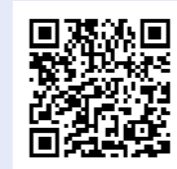
ハザードマップ (今年4月、各家庭に配布)

り組みます。まだまだ日常生活にご不便をお掛けしますがご理解をお願いします。支援制度の詳細は、防災危機管理室にお問い合わせください。毎年この時期には、台風などの影響で大雨が降ることも少なくありません。今回の被災箇所の周辺では、特に注意をお願いします。また、各家庭や近所の皆さんで土砂災害等の危険箇所を、もう一度ご確認ください。