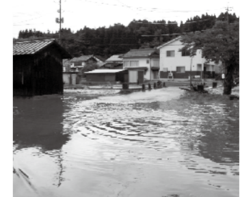
神戸川の氾濫(赤名保育所上流) 赤名では、観測史上最大となる時間雨量71.5mmを記録