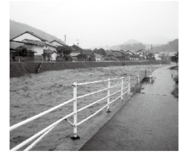
頓原川の増水(頓原大橋下流) 50年に一度と言われる程の記録的な豪雨が短時間で降る