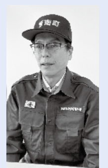
長島防災危機管理室長

今回被災された皆さんに、心からお見舞い申し上げます。また、町建設業協会の皆さんには、応急復旧に迅速に対応いただきありがとうございます。 豪雨災害から1カ月が経過しましたが、国や県の協力もあり、ようやく現地調査を終えました。今後は、道路や河川、農地などの災害復旧に取り