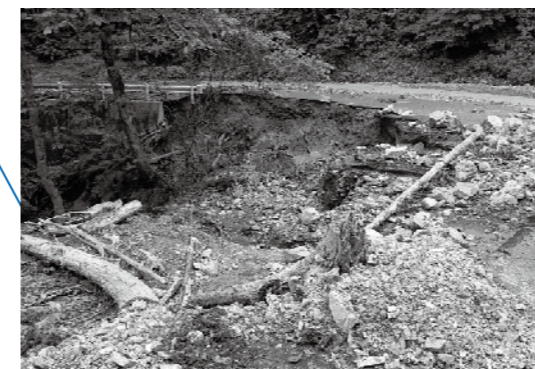
林道小田線の路肩崩壊(土石流)【通行可能時期未定】 これまで土砂等が流出したことがない場所でも流出