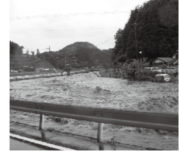
神戸川の増水(加田の湯下流)