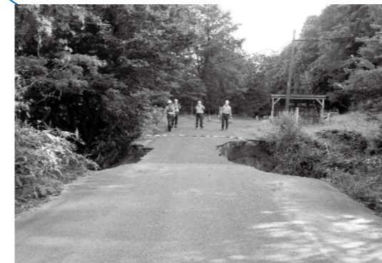
町道頓原都加賀線の両路肩崩落【通行可能時期未定】