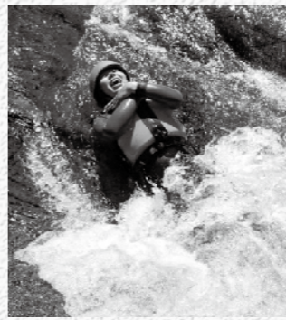
川の流りに身を任せ...