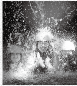
木漏れ日の滝修行

飯南町の夏のアクティビティ「シャワークライミング」が今年も始まりました。シャワークライミングを簡単に言うと