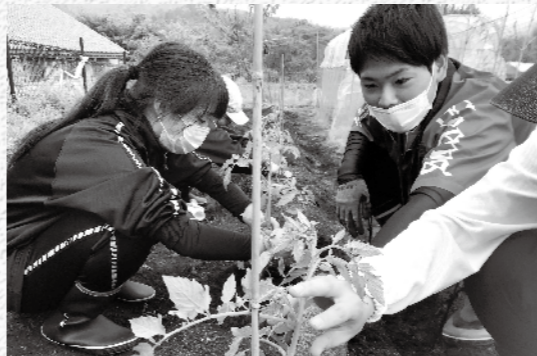
サツマイモ、トマト、キュウリ、ナスを育てています

に貢献したいと考えています。その一環で、生徒のやりたいをカタチにする「生命地域ラボ」に取り組んでいて、生徒と一緒に野菜づくりをしています。果たして収穫できるのか、とても楽しみです。生徒とともにコーディネートとして成長していきますので、どうぞよろしくお祈りします。