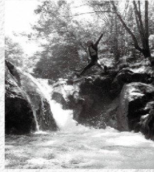
爽快な飛び込みは童心で

「沢登り」。中国山地の源流域の中で体験する爽快アクティビティです。野外で三密になりにくいため、昨年は120人以上が体験してくれました。自然のウォータースライダーで流されたり、滝に打たれたり、豪快に飛び込んだり：思いのままに自然を満喫できます。シャワークライミングで、ある程度身体に負荷を与えた後、森林セラピーで心と体を落ち着かせると、よりリフレッシュできるのでおすすめです。体験に必要な装備は全て体験料に含まれているので、特別な準備はいりません。この夏はぜひ、シャワークライミングをお楽しみください。