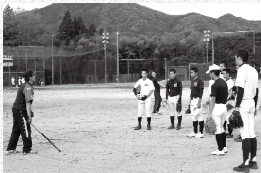
勤務後に野球の指導をしています

大学で農業を勉強していたこともあり、勤務時間外に、頓原・宇山地区の(株)なつかしの森で働きながら農業を勉強しています。トラクターをまっすぐ走らせるのは、すごく難しいですね。