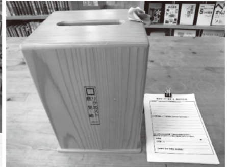
本のリクエストも受け付けています

中山間地域研究センターに併設している図書室は、町民のみなさんをはじめどなたでも利用できます。常設の図書は、農林畜産業や中山間地域関係の少し硬めの内容の本が多いのですが、絵本や自然科学の本、大人向けの小説などバラエティーに富んだ図書100冊を県立図書館から借り受