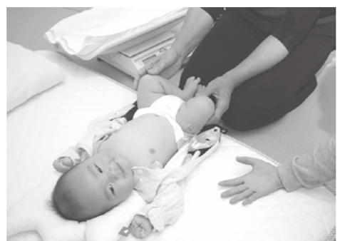
気軽に体重測定にきてください