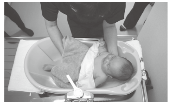
沐浴指導もできますよ