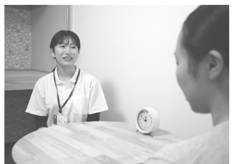
個室でゆっくり相談できます