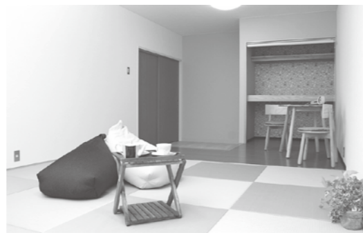
専用のお部屋ができました

新しくなった相談室は、白くて明るいお部屋。ほっとひと休みできる時間をお過ごしください。