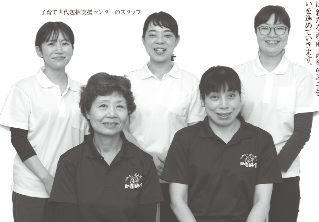
子育て世代包括支援センターのスタッフ

新しくなった相談室は、白くて明るいお部屋。ほっとひと休みできる時間をお過ごしください。