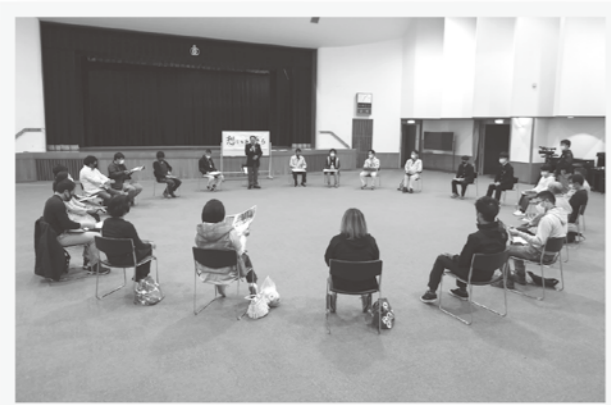
円になって「ゆるい雰囲気」ではじまります