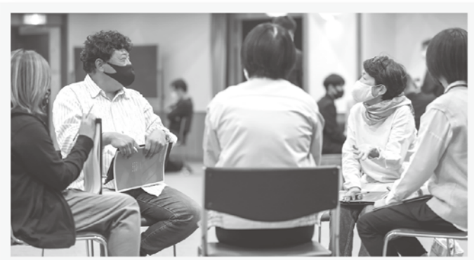
終了間際に会話が弾む。「もう少し時間がほしい」という声も