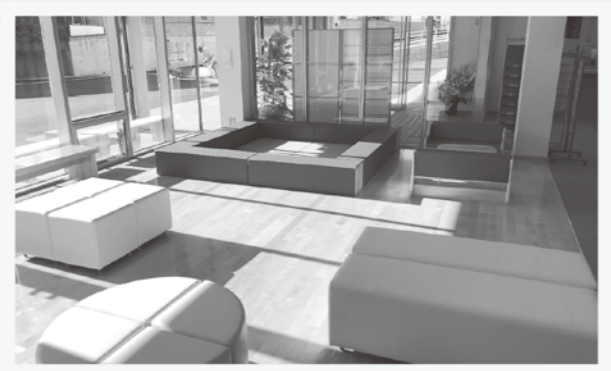
1階「交流スペース」はバスの待合室としても利用できます

この施設の愛称は、応募総数32の中から「みんなの広場 来島交流センター」に決定しました。