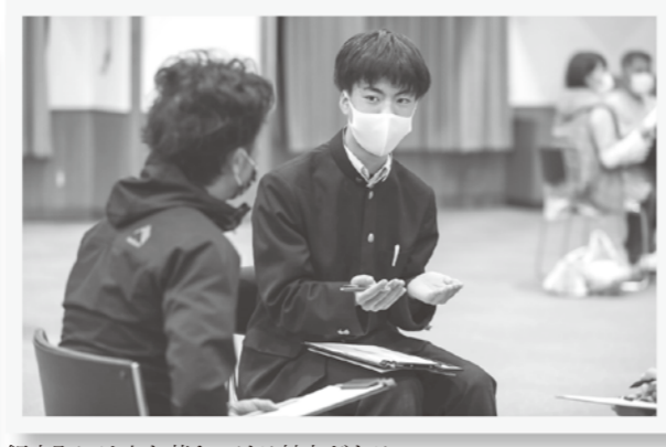
飯南町には人を惹きつける魅力がある。でも町外の人にうまく伝わってないのかも