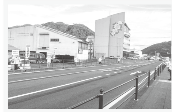
早めのライト点灯で事故防止!

秋の全国交通安全運動に合わせて、町内各所で交通安全啓発活動が行われました。23日には、赤来ライオンズクラブ・森島建設が「交通安全パレード」を実施。赤来地域の道路を、交通安全ののぼり旗を取り付けた軽トラで走りながら、安全運転を呼びかけました。また、29日には、島根県農業協同組合雲南地区本部から、カーブミラー2本の寄贈を受けました。ミラーは町内に順次設置し、交通事故防止に役立てていきます。