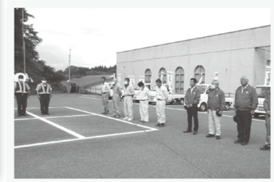
交通安全パレード出発式