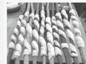
*2 雑木にパン生地を巻き、おき火で焼きます。