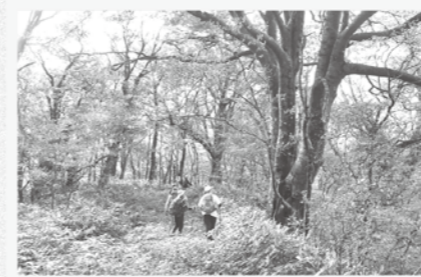
*1 琴引山縦走はふれあい講座の中ではロングコースの約10キロ。琴引山山頂からは野萱ルートで下山します。

秋風が吹き、野山の散策にも良い季節となりました。県民の森には大万木山を中心に数々の登山ルートが整備されていて、ふれあい講座では縦走コースを利用したトレッキングを開催しています。カエデ類が美しく紅葉する11月上旬は、特におすすめの時期です。