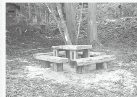
小田川コースの野鳥観察小屋前に設置したテーブル・ベンチ。お弁当・おやつタイムにもどうぞ。