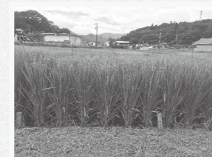
出穂期を迎えたイネ

中山間地域研究センターでは、下赤名ほ場でさまざまな水稲品種の定点調査をしています。今年の生育進捗は、平年よりやや遅く、「コシヒカリ」が8月初旬からお盆にかけて、「きぬむすめ」はお盆過ぎから順次出穂期を迎えています。