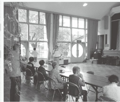
「3密」に気を付けながらの野萱サロン

野萱サロンでは、みんなで七夕の短冊を作りながら、新型コロナウイルス感染症の早期終息を切実に願っていました。