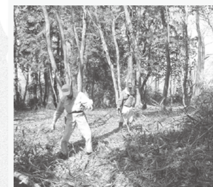
4月に地元の皆さんと賀田城登山道の草を刈りました

上来島健康長生き体操では「やっぱりみんなと顔を合わせ、話をするのはええなあ」と話しながら笑顔で取り組んでいました。「自粛期間中はずっと家から出ない日が続いた」などのお話を聴くこともあり、改めて集いの場の必要性を感じたところです。