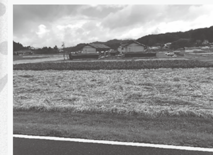
トビイロウカによる坪枯れ症状