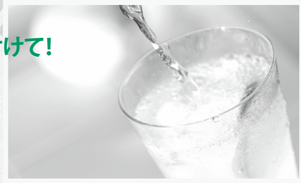
お好みでレモンの輪切りを加えてもOK

レモンに含まれるクエン酸が熱中症の予防に良いと言われています。熱中症対策にぴったりのレモンジュースでこの夏を乗り切りましょう!