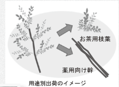
用途別出荷のイメージ