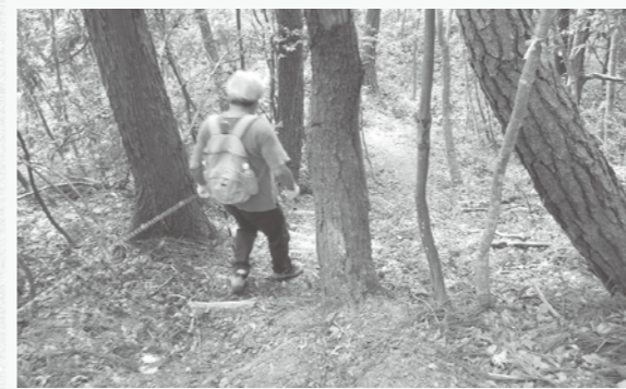
鎖場=ロープを張って歩きやすくしてあるところ

赤名小学校登山口から頂上まで1キロのコースは約30分で登れ、コース脇には草木の案内もあり、自然を楽しみながらハイキングできます。本丸に着くと、額にうっすらと汗が…。