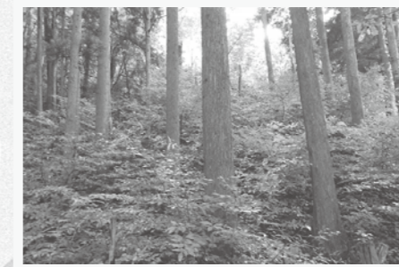
スギ林内に生育しているクロモジ

●中山間地域研究センター 電話 0854-76-2025 http://www.pref.shimane.lg.jp/chusankan/