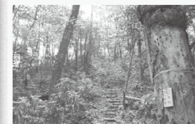
武名ヶ平山山頂への最後の登り