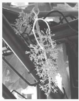
ジベレリン処理後のシャインマスカット

● ダイオウグミ (ビククリグミ) 実を付けないため受粉樹としてナツグミを追加購入。 ● フィンガーライム なかなか実をつけません。 ● 野イチゴ クサイチゴとモミジイチゴの苗を購入 ● とうもろこし 種からポット栽培を行い、自宅の畑に25本植え替え終了。