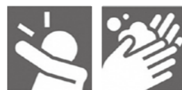
咳エチケット 手洗い