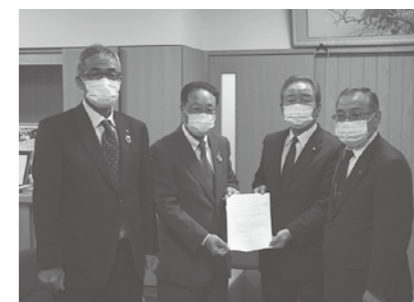
申入書を手渡す早稲議長と内藤副議長