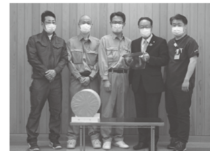
飯南病院や福祉施設、保育所などに配布予定です