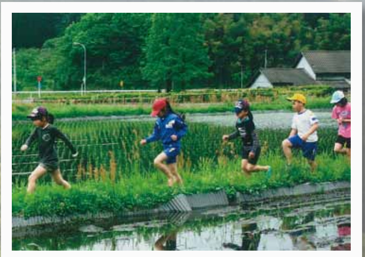
【一般カメラの部】 優秀賞