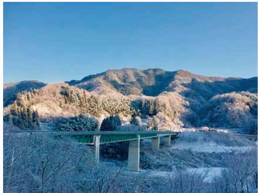
【携帯フォトの部】 優秀賞

飯南町ならではの一枚。大しめ縄と人間の対比が面白く、しめ縄の大きさがよく伝わる写真。しめ縄の大きさ、力強さが感じられる。