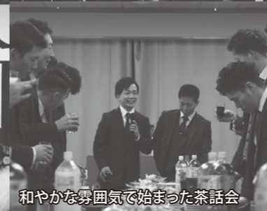
和やかな雰囲気ではじまった茶話会