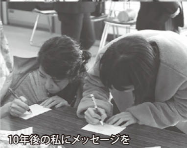
10年後の私にメッセージを