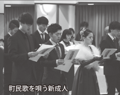
町民歌を唱う新成人