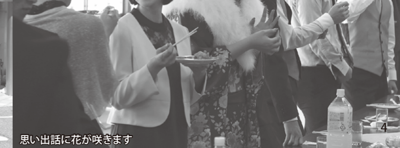
思い出話に花が咲きます