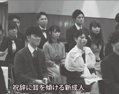
祝辞に耳を傾ける新成人