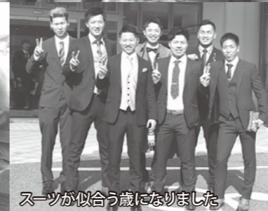
スーツが似合う歳になりました