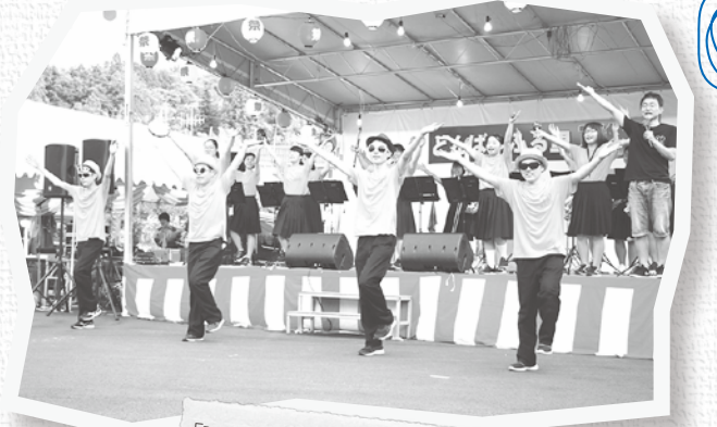
「Y・M・C・A」(頼原中学校吹奏楽部)