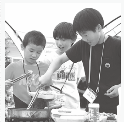
まずは豚肉から炒めてみようか(焼きそばづくり)

梅雨明け間近のこの日、旧小田小学校で来島小学校の児童を対象に「ムラサキキッズキャンプ」が開催されました。 子どもたちは、自分たちで作ったおいしいご飯を食べ、ゲームや花火で盛り上がった後、テントで眠りにつきました。あいにくの雨で県民の森での自然体験はできませんでしたが、子どもたちはご飯の準備やテントの設営など、集団で活動すること