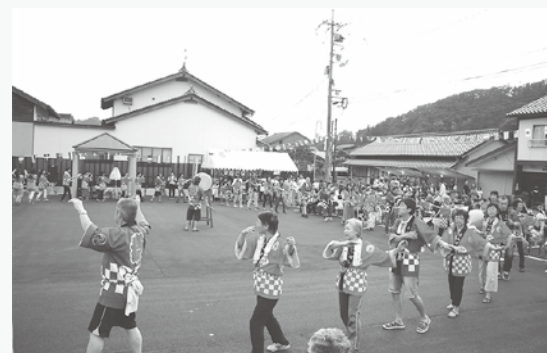
盆踊りの大きな輪