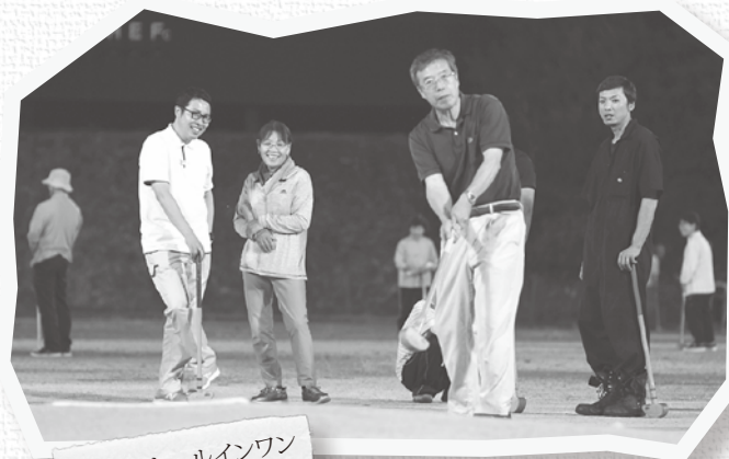
22人がホールインワン

の面白さを感じていたようでした。 この活動は、子どもたちに豊かな自然と親しみながら集団活動できる機会を提供したいと、来島公民館が毎年開催しています。