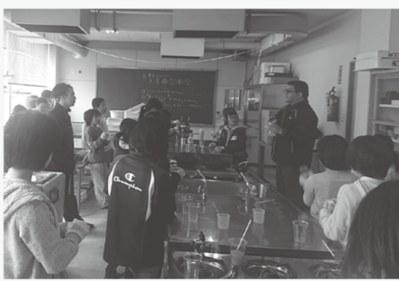
理科実験でスライムづくり

支援館では、進学の決まった中学校3年生が、塾に通う飯南高校の先輩から高校生活について話を聞く座