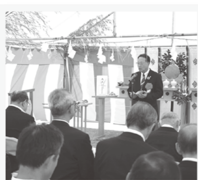
公民館、図書館、学習支援館などが入所予定