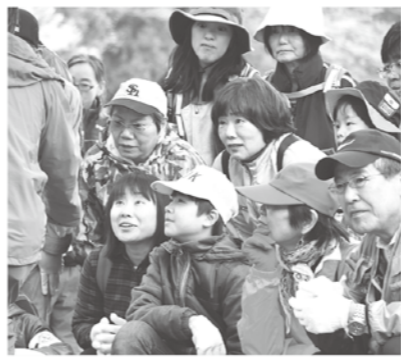
参加者の顔も自然と楽しそう

春の谷地区を舞台に「谷間の楽校 自然と遊ぼう+α山菜採集」が谷 公民館主催で開催されました。