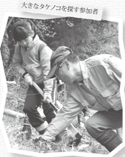
大きなタケノコを探す参加者

野萱地区の竹林で「タケノコ王決 定戦」が開催され、4家族13名の参 加がありました。ルールは簡単で、 1時間でより多くのタケノコを掘つ たチームにタケノコ王の称号が与え られます。参加者は大きそうなタケ ノコに狙いを定め、クワなどを使い 掘っていました。