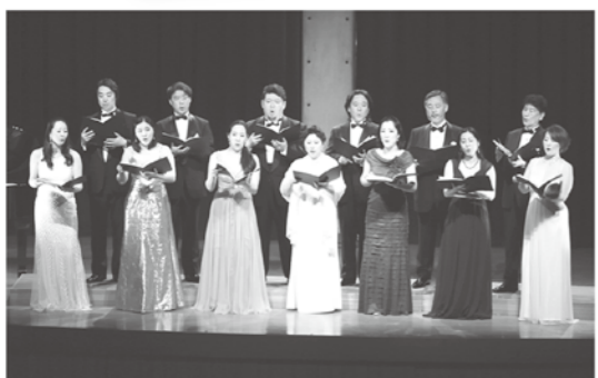
東京オペラシンガーズの皆さん