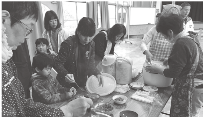
熱々のタケノコご飯とイノシシ汁

タケノコ掘りの後は、会場を来島 公民館に移し、交流会と表彰式。会 場には、運営委員が用意したタケ ノコご飯とイノシシ汁が並べられ、 参加者とスタッフでおいしい食事を 囲みながらの楽しい時間を過ごし