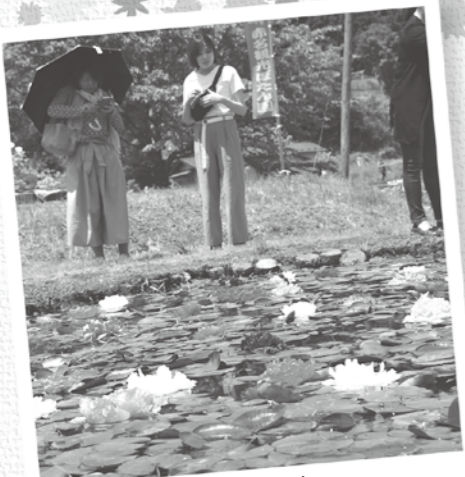
牡丹(ぼたん)と蓮(はす)の池

赤名観光ぼたん園周辺を会場に 「ぼたんまつり」が開催され、期間中 多くの来場者で賑わいました。 メインイベント日となった5月12 日は天候にも恵まれ、有志によるテ ント村や働く車コーナー、保育所園 児による銭太鼓披露など町内各種 団体によるステージイベントも行わ れ、約6800人の来場者を集めま した。 また、「よさこい2019 in い なん」が今年も同時開催され、飯南 牡丹組をはじめ、遠くは益田市から 21団体が集まり、気合の入った華麗 な舞いが披露されました。