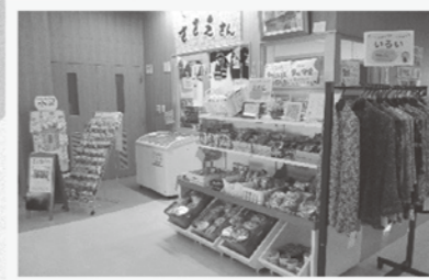
お助けショップ「ささえさん」開店中

地域に商店が無くなったことをきっかけに始めた小さなお店。皆さんのニーズを聞きながら商品を仕入れています。 ※商品の配達や交通手段を持たない方の送迎もしています。