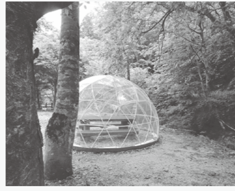
素敵なプライベート空間が完成!

森林セラピー基地の入り口に、寒い日や雨の日の休憩所として利用できる、ドーム型ビニールテント「ガーデンイングリッド」を昨年から設置しています。 ドイツ製で、風速17m、積雪1mまでの耐久性がありますが、例年、森林セラピー基地周辺は1mを越える積雪があるため、昨年12月中旬に片付けていました。