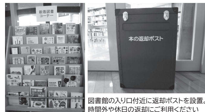
図書館の入り口付近に返却ポストを設置。時間外や休日の返却にご利用ください

中山間地域研究センターに併設している図書室は、町民の皆さんをはじめどなたでも利用できます。常設の図書は、農林畜産業や中山間地域関係の少し硬めの本が多いのですが、県立図書館から絵本や自然科学の本、大人向けの小説などバラエティーに富んだ図書100冊を借り受けて3カ月おきに更新しています。図書室の本は誰でも借りることができますが、初めて本を借りる人は、「利用者カード」の作成のため、住所が確認できるものを持参してください。また、本を借りるだけでなく、学生の皆さんの勉強の場、お子さんや家族連れの団らんの場としても利用できます。皆さんのお越しをお待ちしています。