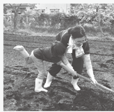
志津見やまびご会

せや関係機関との連携により、徐々に活動に広がりが出てきていることを実感しています。