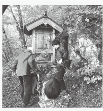
琴引山で琴の岩屋探索

事務局を務めている国道54号活性化アクションプラン推進協議会では、飯南町の魅力と課題として「自然」「食」「歴史・文化」「人と道」の4つを掲げ、国道54号沿線の活性化を目指した取り組みをしています(広報いーなんぬくもり情報局で毎月紹介中)。