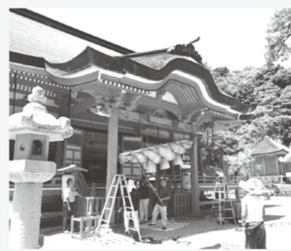
日御碕神社でしめ縄の取り付け応援

今後の目標は、飯南町の情報発信力の強化。私自身がパイプ役となつて取り組んでいきます。また、雪の時期になると、毎年スノーキャンドルイベントを開催しています。6回目となる今回の内容を、本誌ぬくもり情報局(18P)に掲載していますのでご覧ください。