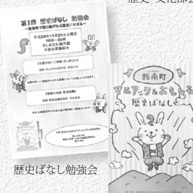
歴史ばなし勉強会