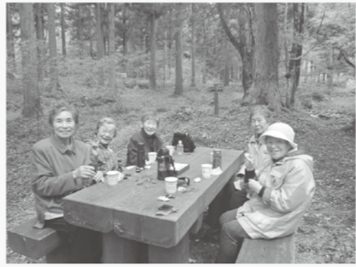
歩かなくても笑顔いっぱい

飯南町の森林セラピーのコースは4つ。それぞれを組み合わせることが出来ます。町民向け森林セラピーでは、癒し効果の高いエリアまで送迎も可能。少しだけゆっくり歩いてもそこは、グリーングリーングリーンの世界。ゆっくり過ごしていただけます。