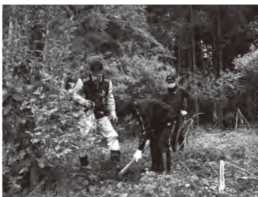
「もう少しで収穫できるよ」とエールが響く

4.24 春の来島de味覚満喫 タケノコ掘り大会 野萱地区の竹林で「タケノコ掘り大会」が開催されました。 参加したのは、町内の子どもとその保護者、飯南高校生など15人。地面に頭を出すタケノコを探しあて、クワやスコップで慎重に掘り起こしていきました。 収穫後には、来島交流センターの駐車場で、タケノコ飯や山菜の天ぷら、香茸おむすびが振る舞われ、参加者全員でおいしくいただきました。 このイベントは、来島地区の町民13人で構成される来島公民館運営協議会が企画。