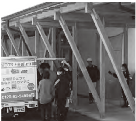
「高校生には安くしてあげたいね」と本音も