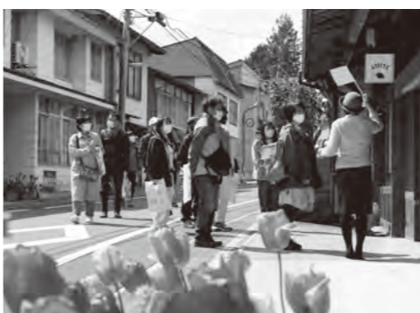
これまでの講座で参加者から挙げられた魅力ある場所を訪ねました(「鐘や」前)