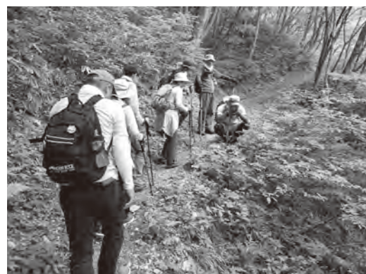
山頂までの道中も様々な植物を観察

5.7 森の妖精「サンカヨウ」を目指して 春の大万木山トレッキング2022 （一社）飯南町観光協会主催の「春の大万木山トレッキング」2022が開催されました。 頂上周辺に咲く、森の妖精とも称される「サンカヨウ」を見るために集まったのは25人。飯南町森の案内人の説明を聞きながら山を登り、頂上では、大万木山のシンボルであるブナの木の前で記念撮影を行いました。 昼食後、参加者は山頂周辺に見事に咲きほころぶサンカヨウを撮影するなど、春の大万木山を堪能しました。