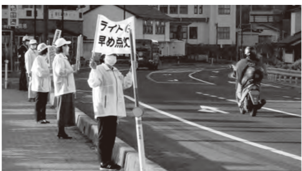
早めのライト点灯で事故防止

4月8日には、雲南地区交通安全協会飯南支部により、国道54号の歩道で「早めのライト点灯」の啓発活動が実施されました。