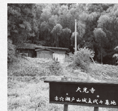
現在の大光寺(上赤名向谷)