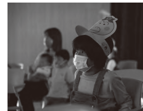
グッズを被って映画を楽しみました

5.5 大画面にくぎ付けの子どもたち こどもの日映画祭 来島交流センターで「こどもの日映画祭」が開催されました。 この日は町内の親子80人が参加し、子どもたちは目の前の大きなスクリーンを夢中で見つめていました。上映されたのは、子ども向けアニメ「はなかつぱ」の劇場版で、親子の絆が深まる作品となりました。 「コロナ禍でなかなか町外の映画館に出掛けられないことや、子どもたちが公民館事業へ参加するきっかけとなれば」と初めて企画されました。