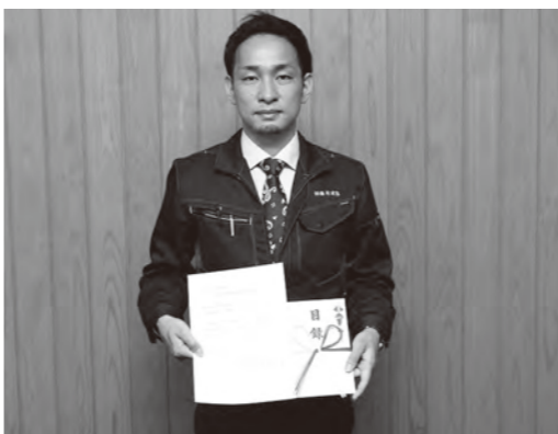
島根県から「しまね子育て『こころカンパニー』」にも認定

子育てしやすい職場を目指して （株）藤原建設を「子育て応援企業」に認定 仕事と子育てを両立できる職場環境づくりと、地域の子育て支援活動に積極的に取り組む「飯南町子育て応援企業」に、（株）藤原建設を認定しました。 同社は、子育て中の職員への労働時間短縮に加え、育児に関わる有給休暇の時間単位取得、始業・終業時刻の繰り上げ・繰り下げ勤務など、独自の取組を実施。子どもたちの登下校時のパトロールなど、地域貢献活動も実施されています。