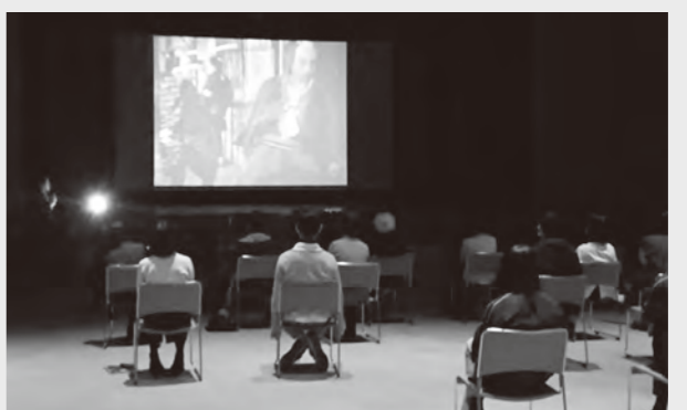
無声映画に声を乗せて、笑いを届けます