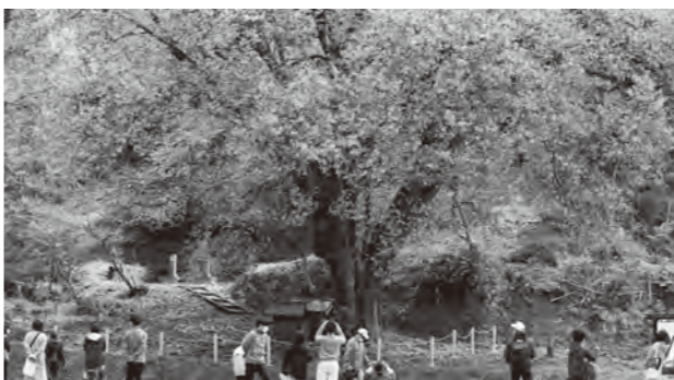
参加者が撮影した写真はInstagramから「#まちマジいいなん」で検索できます(お大師桜)