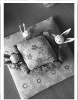
「かわいい！」と大人気のウサギさん

町のにぎわいづくりにと、平成21年から始まり、今年で9回目の開催。地元や近隣市町、松江市や出雲市など遠方からの来場者もあり、期間中約300人の来場者でにぎわいました。