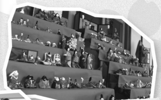
今年は「立ちびな」を作りました