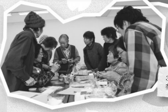
3月8日の製作会には13人の参加者が集まりました