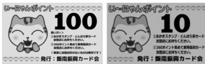
100ポイント 10ポイント

ポイント発行 ポイントは、イベント・物販・サービス利用等、加盟店が独自に決めたルールに基づいて発行。