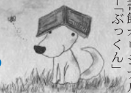
飯南町立図書館オリジナルキャラクター「ぶつくん」

子どもたちが待ちに待った夏休みがやってきました!今年はお家でも、どんな計画を立てられたでしょうか?海やプール、旅など、遊びの計画は楽しいものですが、図書館でも楽しい企画をご用意しました!皆さんの来館をお待ちしています。 勉強の息抜きに 「クロスワードクイズに挑戦!」 たまには宿題をお休みして、クロスワードクイズで頭の体操。夏休み期間中、カウンターで配布しています。正解者にはプレゼントも! 宿題のヒントは図書館で 「こども宿題コーナー」 夏休みといえば自由研究・工