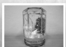
貝殻などを入れたスノードーム

作・新聞づくり!いろいろあるけど何をしたら良いの?そんな悩みを解決する本を揃えています。 みんな大好き謎解きゲーム 「謎解きはランチのあとで...」 8月8日(火) 13時30分 図書館に突然、謎の怪盗Tから挑戦状が送られてきた!?暗号を解いて図書館の大事な本を守ろう! 作って、食べて、楽しむっばい 「クッキング&ものづくり」 8月10日(木) 10時~15時 夏野菜を使った料理と、見て楽しいスノードームを作ります。作った作品は持ち帰れるので、工作の宿題にもなるのではないのでしょうか? 参加費:500円 対象:小学生 定員:12名 詳細はイベントポスターをご覧ください。 ■お問合せ 飯南町立図書館 (交流センターとんぼら内) 電話 72・0301