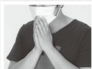
インフルエンザの予防には「不織布マスク」

参加者の皆さんは、久しぶりに会った同級生と談笑され、懐かしさ半分、今後の人生にためになる学び半分、楽しく有意義な時間を過ごされました。