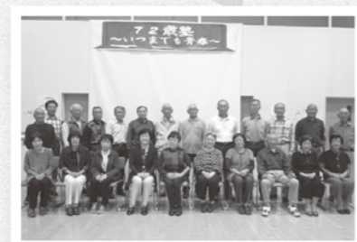
元気にいきいき72歳!

④8020(80歳になっても20本以上の歯を残そう!)達成を目指して、自分の歯を大切にしておきたい歳です。