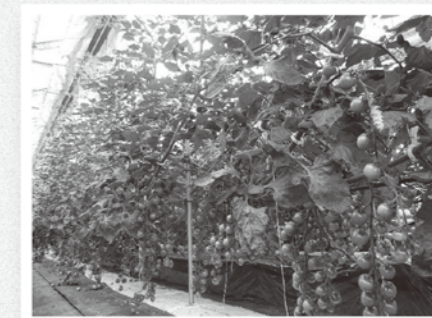
栽培試験中のミニトマト

当センターでは、トマトの年2期作栽培の方法を研究しています。 従来、中山間地域では、7～10月に収穫する、夏秋作型のトマト栽培が主流です。年2期作では、5～7月と9～12月に収穫が可能となり、収穫期間が長