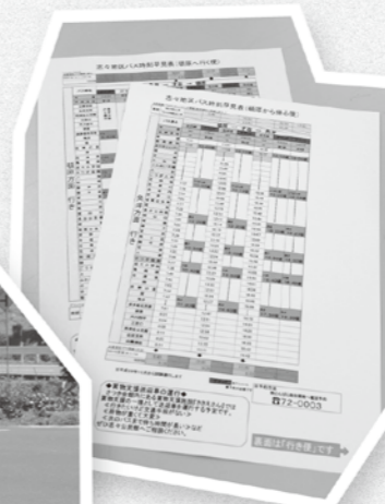
志々地区独自のバス時刻早見表