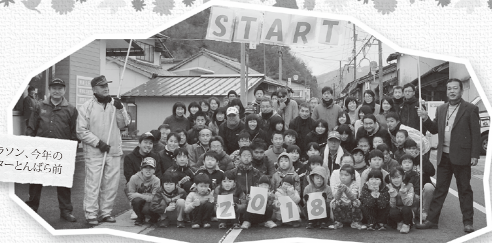
頓原地区の元旦マラソン、今年のスタートは交流センターとんぼら前