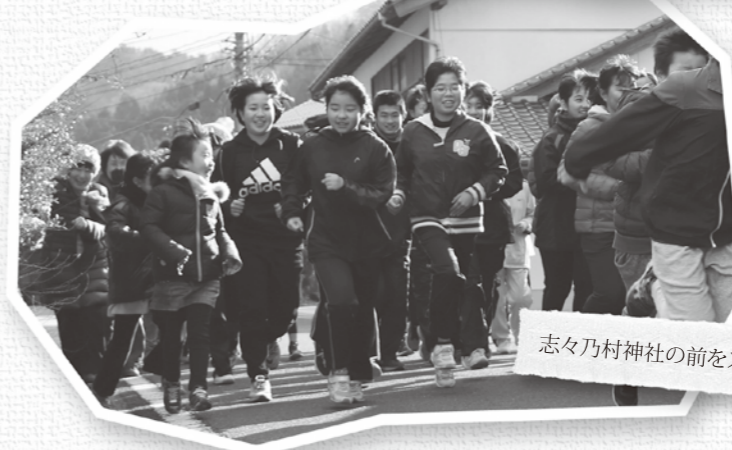
志々乃村神社の前をスタート!

新年、毎年恒例、公民館主催の元旦マラソンが、頓原、志々両地区で開催されました。3年連続の雪のないおだやかな元旦を迎え、頓原地区には80人、志々地区には60人の参加者が集まりました。 参加者は、時折、青空がのぞき暖かい朝日がふり注ぐ元旦の街なかを、新年のあいさつを交わしながら元氣よく駆け抜けました。 ゴールしたあとは、福引抽選会もあり、新年最初の運試しに会場はにぎわっていました。