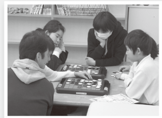
みんなでオセロで遊びました

志々地区で1月から放課後子ども教室(みのりん畑)を開設しています。 この活動は、放課後に児童が安心・安全に過ごす居場所を提供することを目的として、志々小学校の児童を対象に行っています。 宿題をしたり、なつかしの遊びや地域の皆さんとの交流活動をしてもらって過ごしています。