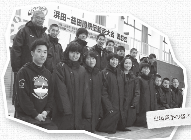
出場選手の皆さん

本町は、当初予定していたメンバーを故障で欠き、新聞発表とは大幅に変更になったメンバーでの出場となりましたが、久しぶりに走る社人から初めて走る中学生まで、ど