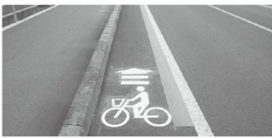
落下物ではありません(自転車ピクトグラム)

案内看板 道の駅や周遊コースとの分岐点などに設置。近隣市への距離や付近の周遊コースを案内