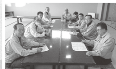
建設業の皆さんを対象に勉強会

企業の元気は、地域の元気、まちの元気。「笑顔あふれるまち」の実現に向けて、これからも事業所におじゃまします！一緒に「健康経営」考えてみませんか？