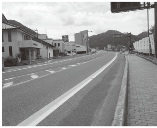
ブルーグリーンの自転車通行明示ライン

自転車の方へ ブルーグリーンのラインは「自転車専用通行帯」ではありません。今までもおり、「自転車通行可」の歩道は歩行者に配慮しつつ通行できます。車道の左側を走行してください。逆走・並走は危険です。 自動車の方へ 自転車に注意してください。追い越す際は自転車との間を十分取ってください 歩行者の方へ ブルーグリーンのラインは、歩道ではありません。歩行者は歩道を通行してください。