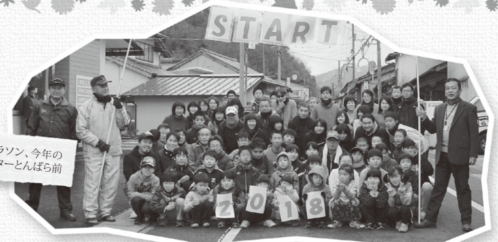
頓原地区の元旦マラソン、今年のスタートは交流センターとんぼら前