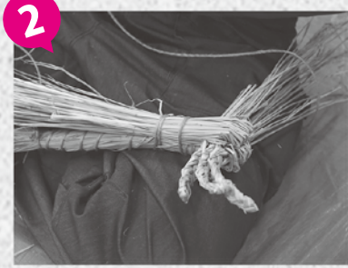
2 続いて、首と前足をつくります