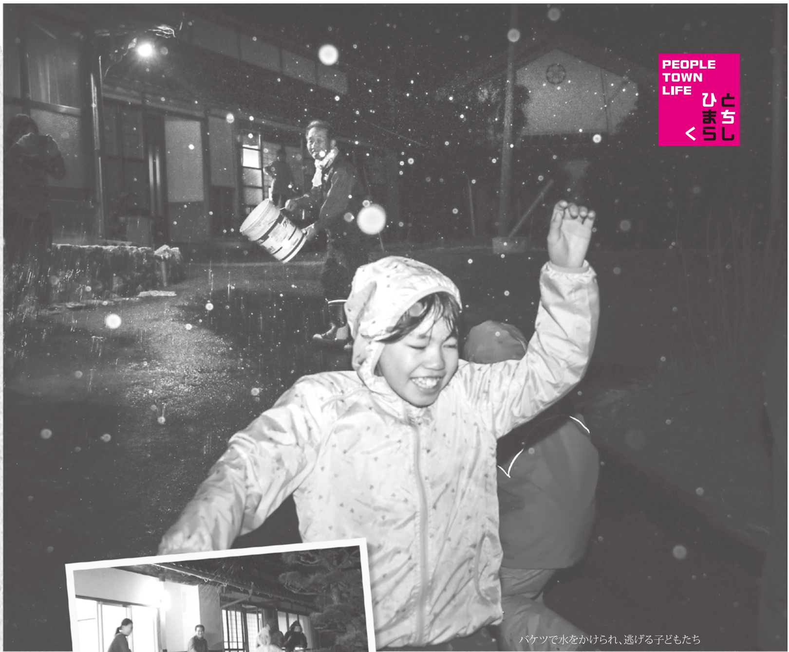
バケツで水をかけられ、逃げる子どもたち