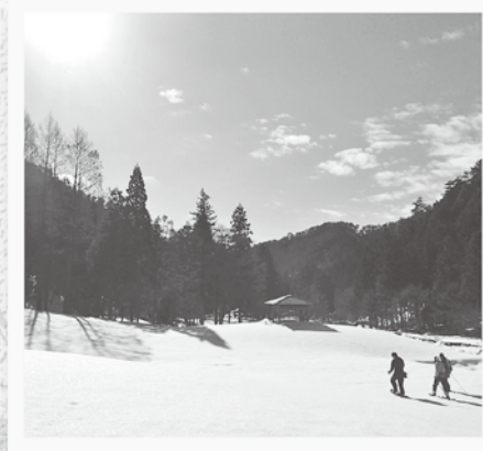
冬晴れの中、スノーシューをはいて雪原を歩く

大きく垂れ下がるつららや未踏の雪原。その中で力強く生き抜く動物たちの気配をアニマルトラッキングから感じ