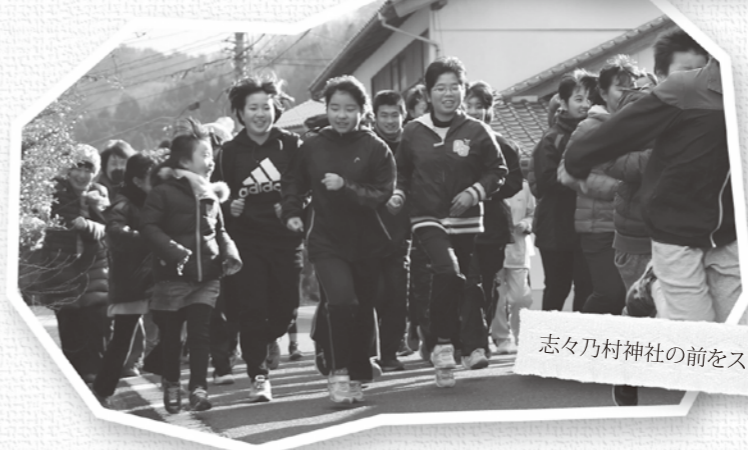
志々乃村神社の前をスタート!

新年、毎年恒例、公民館主催の元旦マラソンが、頓原、志々両地区で開催されました。3年連続の雪のないおだやかな元旦を迎え、頓原地区には80人、志々地区には60人の参加者が集まりました。 参加者は、時折、青空がのぞき暖かい朝日がふり注ぐ元旦の街なかを、新年のあいさつを交わしながら元氣よく駆け抜けました。 ゴールしたあとは、福引抽選会もあり、新年最初の運試しに会場はにぎわっていました。