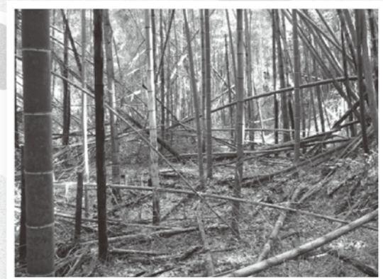
荒廃された放置竹林

「広がる竹林をどうしよう？ 放置竹林の把握と効率的な駆除技術」 ※農林水産省・食品産業科学技術研究推進事業「侵略的拡大竹林の効率的駆除法と植生誘導技術の開発」により作成