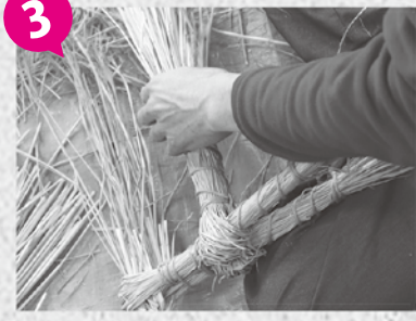
3 次に、胴体とうしろ足、しっぽをつくります