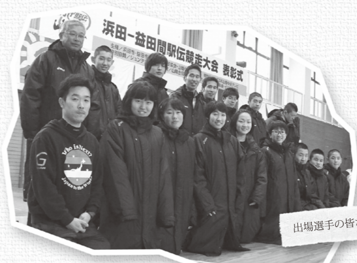
出場選手の皆さん

本町は、当初予定していたメンバーを故障で欠き、新聞発表とは大幅に変更になったメンバーでの出場となりましたが、久しぶりに走る社人から初めて走る中学生まで、ど