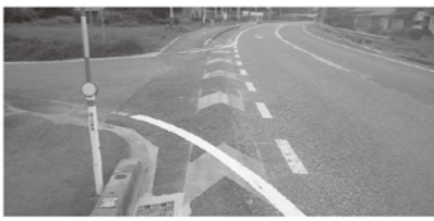
ブルーグリーンの矢羽根