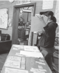
保健師が事業所に出張します

事業所の健康づくりの推進・継続には、事業主や代表者の皆さんに、働きざかり世代の健康づくりの必要性を理解していただき、事業所で一体となって取り組むことが必要だと考えています。