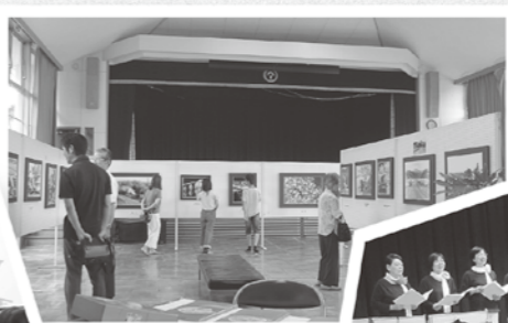
8月に開催した「山崎昭三写真展」