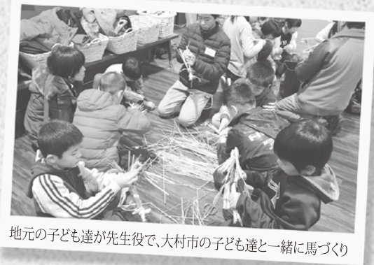
地元の子ども達が先生役で、大村市の子ども達と一緒に馬づくり

われていきましたが、現在行われているのは頓原の張戸地区と長谷地区です。 頓原の張戸地区では、近年、友好交流都市の長崎県大村市の子どもたちとの交流事業として、頓原公民館の協力により開催されています。今年、町内と大村市の子どもたち34人が、5つのグループに分かれて張戸地区の10戸を巡りました。