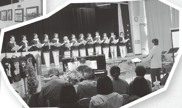
ゲスト出演のコーラスグループ「キュージュー」