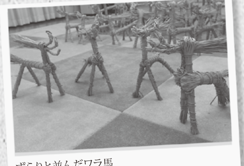
ざらりと並んだワラ馬

も前から受け継がれてきた伝統の行事が、子どもたちに確かに受け継がれています。少し前まで、とろへい行事をやっていたという地域も多いため。来年は、あなたの地区でもとろへい行事を復活させてみませんか？