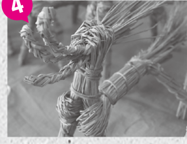
4 とろへいのワラ馬の完成!