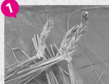
1 まずは口の部分を三つ編みでつくります