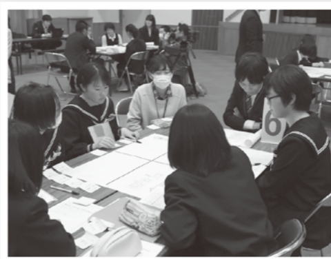
大人のアドバイスを受けながらみんなで討論

はじめに、各小中学校、高校の児童・生徒が、学校の学習や卒業研究で取り組んだ内容を発表しました。飯南高校の生徒は、「国道54号線沿いの道の駅周辺のゴミを減らす方法を提案します」と題して、生徒自らの写真を印刷した「ポイ捨て許さない」と呼びかけるポスターを作成したり、ゴミ箱を設置してゴミの量を集計したりした取り組みを説明しました。