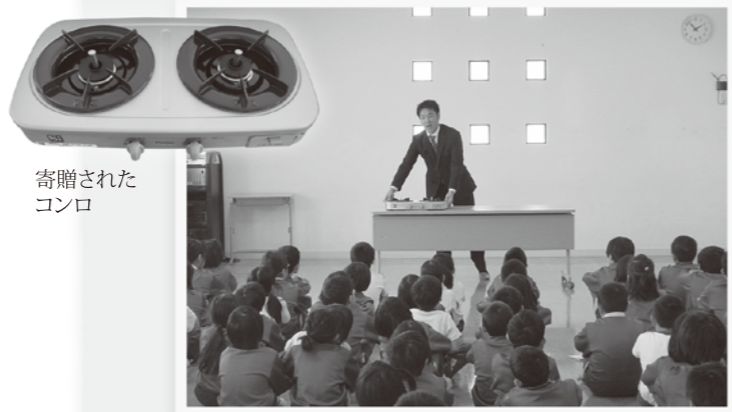
寄贈されたコンロ

寄贈されたコンロは、調理油過熱防止装置や消し忘れ消火装置、焦げ付き消火機能などの機能が、今後、学校の授業等で活用していきます。