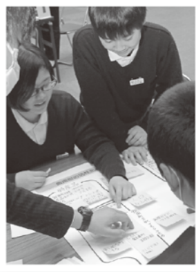
児童・生徒それぞれが主体的に参加しました