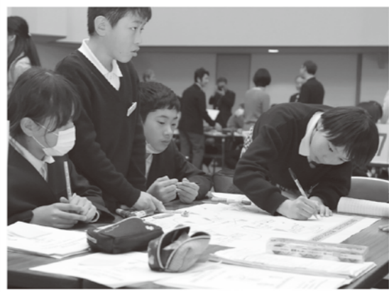
真剣にまちの未来を考えます

また、「飯南町の活性化のために、あなたはどんな提案をしますか」をテーマに、グループに分かれて討論。「イベントは企画するだけじゃなくて、私たちも参加していきたい」などと発表がありました。