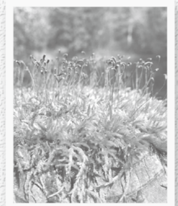
ヤノウエノアカコケ

しいミツマタのつばみやアオゲラのドラミングの音、タヌキやキツネの足跡がたくさんあり、しつかりとした生命の気配を感じる事ができました。 冬の森は空気も澄んでいて、深呼吸をすると清々しい空気が胸いっぱい染みわたります。冬のセラピーを満喫できる一日でした。