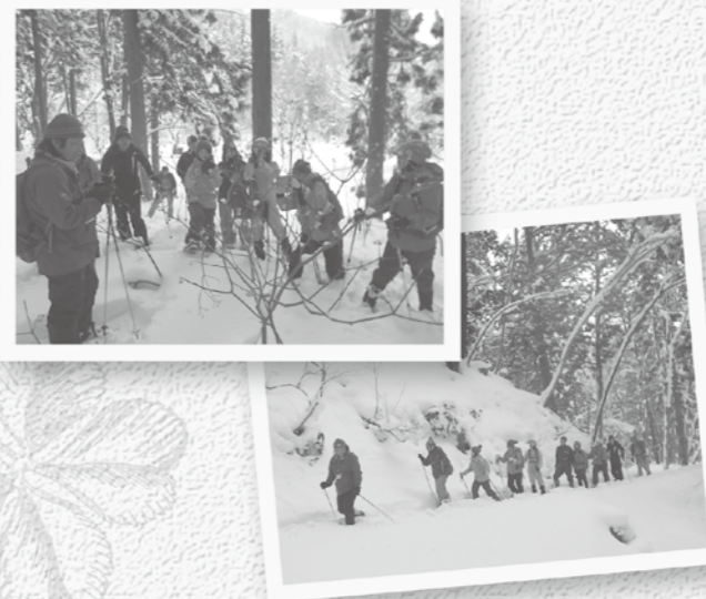
ふわふわの雪の上を歩きます