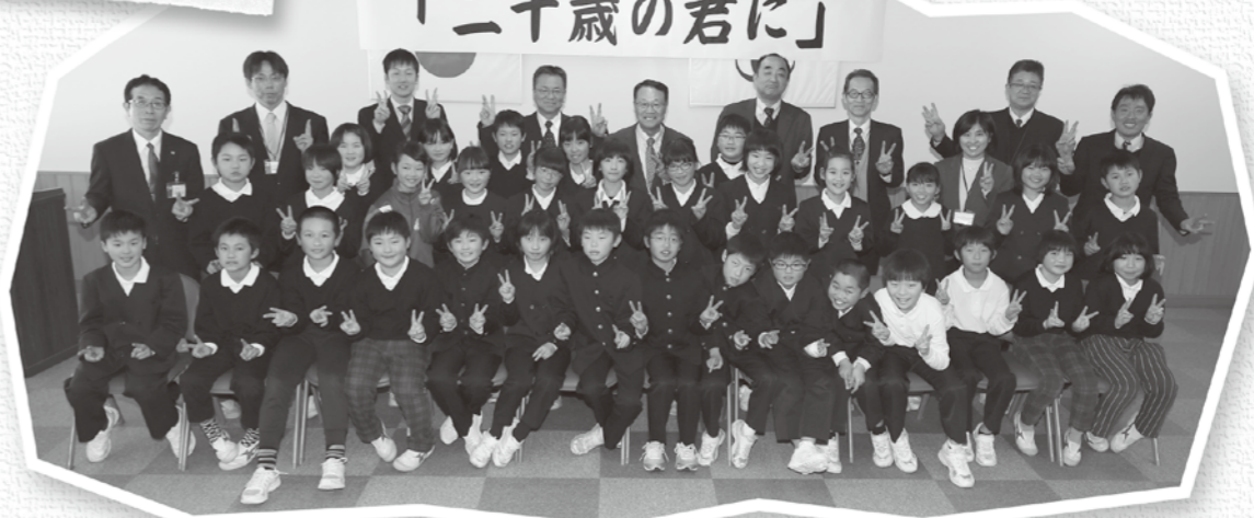
平成29年度 飯南町第4学年