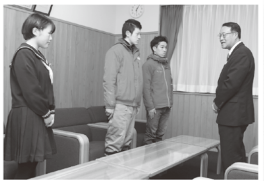
大会への決意を誓う選手の皆さん