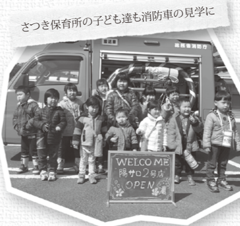
さつき保育所の子ども達も消防車の見学に

志々地区自主防災組織が主催する「防災サロン」が、さつき会館を会場に開催されました。 会場では、かまどによる炊き出しや非常食の試食、簡易トイレなどの防災用品の展示のほか、雲南消防署から講師を招き、火災を想定した避難訓練や初期消火訓練などが実施されました。また、夜間には、消防団研修として、昨年消防庁から貸与を受けた消防車輛の操作研修が行われました。