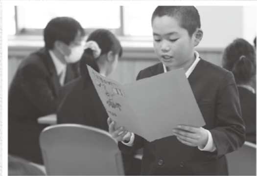
一人ひとりが将来の夢を話しました

町内の小学4年生全員が、一つの場所に集い、将来の夢を語ることを通して、協力や友愛、ふるさとへの愛着を育んでもらおうと、「二十歳の君に」と題した、2分の1成人式を開催しました。 子ども達はそれぞれに、今頑張っていることや、将来の夢などを書き記した、10年後の自分自身に宛てた手紙を発表。それを聞いた子ども達からは、「がんばってほしい」「私ももっと大きな夢を持ちたい」などと感想を話していました。