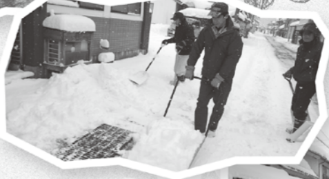
高齢者宅の前を除雪