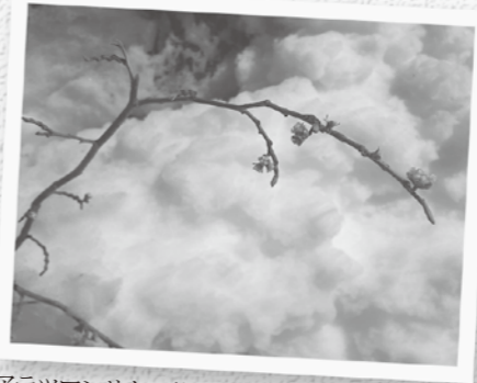
アテツマンサクの花