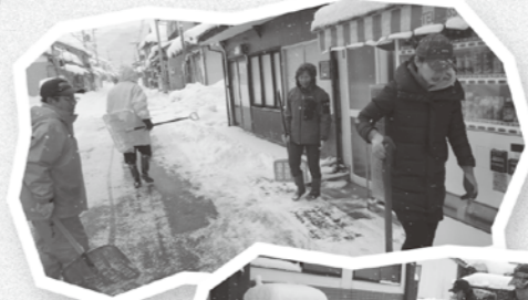
多くの地域の皆さんが参加

赤名自治振興協議会が、高齢者世帯等の玄関先などを除雪する「スノーヘルパー」(ボランティア)を発足させました。 昨年、協議会開催の度に、地域の困りごとについて話し合いが行われてきましたが、まず、「赤名連担地の高齢者世帯の除雪対策が急務だ」との意見が出ました。 実施にあたり、多くの課題が挙げられましたが、地域のボランティアでスタートすることになりました。今年に入ってから、1月21日・28日、2月4日・18日と4回実施。ボランティアの参加者は約20名と、多くの皆さんが参加されています。 今回は、「高齢者世帯の除雪」という問題に取り組みましたが、地域には課題が山積みです。求められる支