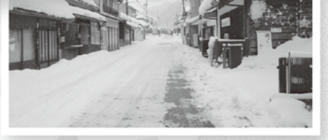
家の前には雪の山が...

住みよいまちへ 集落支援員 町内5地区で活動する、地域とともに歩む「集落支援員」の活動を紹介します。