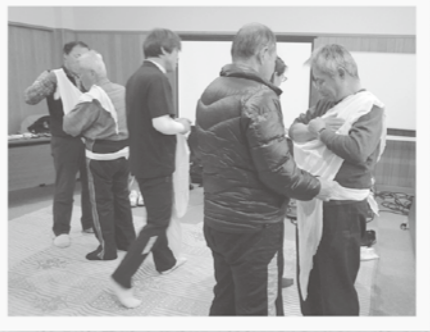
包帯法を実践で学びました

森林セラピーに参加されるお客さまに、安全に安心して森を散策していただくために、ガイドの救命救急のスキル・知識は必要不可欠です。 日本赤十字社島根県支部の救急救命士を講師に招き、ハチやヘビ等の危険