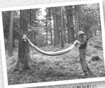
移住先決定の決め手のひとつが飯南町の森林セラピー

私と森林セラピーとの出会いは、旅行情報誌に掲載された西沢渓谷(山梨県)の記事。美しい滝の写真に心惹かれて、渓谷のセラピーロードを歩いてみると、本当に気持ちよく、身も心も癒されたように感じ、「森林セラピーって何だろう」と気になって調べ始めたのがきっかけです。