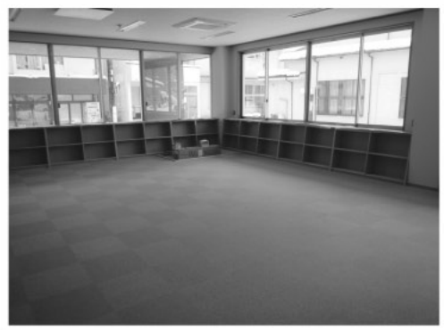
大きな外窓の図書館。明るい室内になっています

新しい図書館は6月1日開館予定 頓原拠点複合施設のオープン予 定日6月1日(木)に合わせて開館 する予定です。 現在の図書館の利用は5月14日(日) が最終日 蔵書点検作業のため、5月15日 (月)～5月31日(水)の間は図書館 の利用ができません。(本の貸出しも 含む)