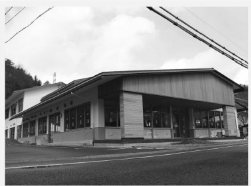
まもなく完成する頓原拠点複合施設

本の返却は5月14日(日)までに お願ひします 現在、本の貸出期間は、新刊を除 いて2週間が限度になっています が、5月1日(月)～14日(日)の間 に貸し出した本は、貸出期間が2 週間に満たなくても全て5月14日 (日)までに返却をお願いします。