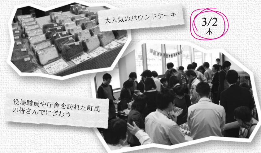
大人気のパウンドケーキ

販売活動を通じた地域の人のふれあいや、雲南分教室への理解と活動の紹介を図るため、出雲養護学校雲南分教室の生徒が、役場庁舎で販売学習を行いました。 会場となった庁舎1階の町民サロンコーナーでは、パウンドケーキやティッシュケース、手提げバッグのほか、自分達が育てた黒豆や大根などを販売。参加した生徒の一人は、「町の皆さんと関わることで嬉しかったです。空気がきれいなところで、また来たいです」と話していました。