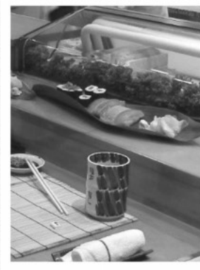
カウンターもヒノキやサワラが材料

その後、首都圏のセラピー基地に通い、3年前の春に島根県に移住。「ふるさとの森」に通いながら森林セラピストの資格を取得しました。 飯南町の森林セラピー基地の魅力は、歩きやすく、穏やかな川のせせらぎや葉擦れの音、風や鳥の声を聞きながら、自然のエネルギーをたっぷりと感じられること。より多くの皆さんにストレスケアの場として、広く活用していただけるよう、地域の皆さんと一緒に活動していきたいと思えます。