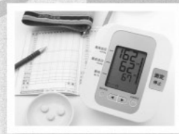
デジタル血圧計 家でも手軽に血圧測定