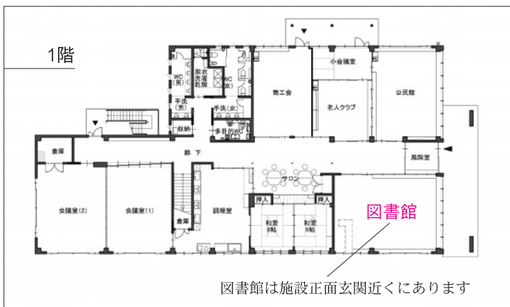
図書館は施設正面玄関近くにあります