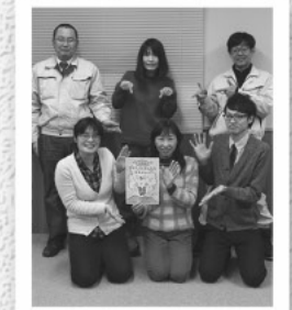
皆さんからの情報をお待ちしています！