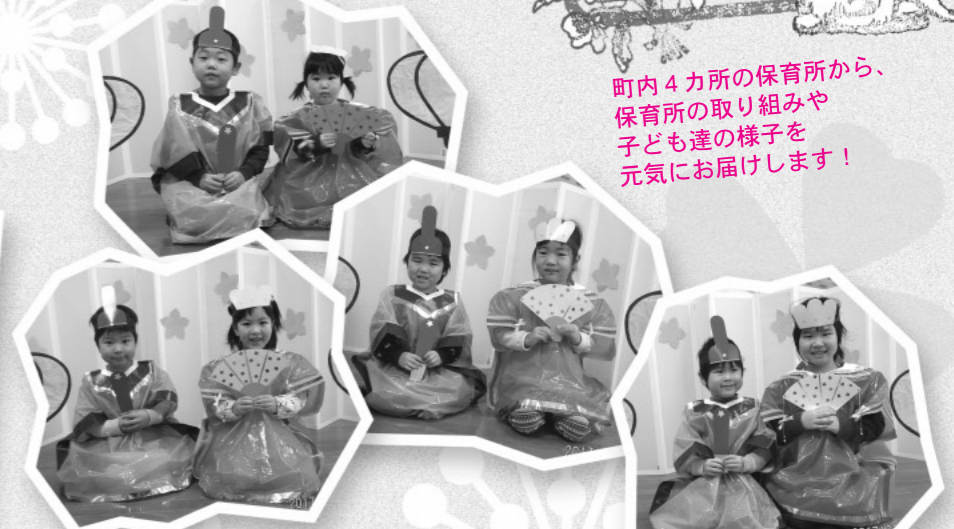
お内裏様とお雛様に変身!うれしいけれど、ちょっぴり恥ずかしそうな記念撮影

「どうしてひしもちは3色なの?」「ひなあられにも意味があるんだよ」という話に、真剣に耳を傾けていました。今後も、昔からある行事や文化に触れることを、大切にしていきたいと思えます。