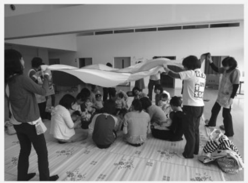
子育てはみんなで楽しく