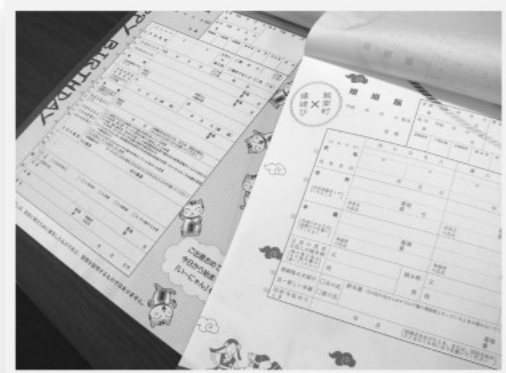
記念用の婚姻届と出生届。役場窓口で配布しています