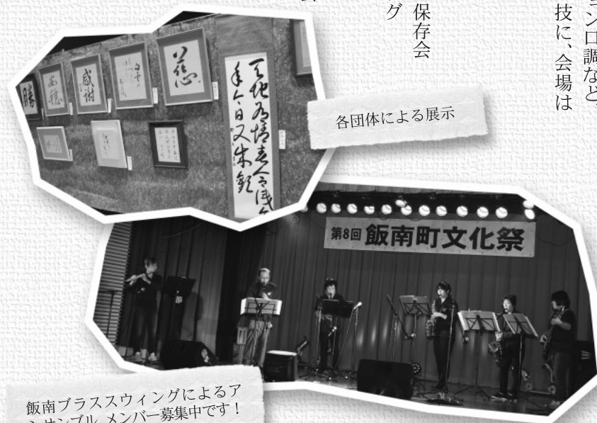
各団体による展示