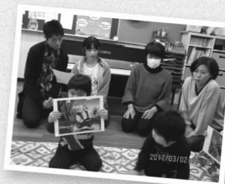
なかなかない高校生と触れ合う機会に、子ども達も大はしゃぎ

飯南高校のお兄さんお姉さんも参加して、大型絵本や絵カードを使ったお話づくり。子ども達は、高校生にべったりで楽しい時間を過ごしました。