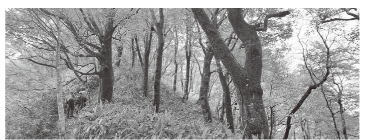
注1 指谷山ブナ林縦走路:広島県との県境沿いを歩き、もりのす前へ下山します。

自然体験講座では、秋の素材を使った苔玉作りを企画しています。森林インストラクターの先生による「森遊び」のコーナーもあり、毎回自然についての新しい発見が得られると好評です。再び森の中が明るくなるこの季節に、ぜひお出かけください。