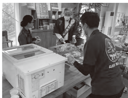
町長も会場でトップセールスを行いました

10月22日・23日の2日間、東京にある「AKOMEYA TOKYO in Iwakagi」で、特産品をPRしました。 「AKOMEYA」は、関東を中心に店舗を展開する米販売の専門店。全国から厳選した米を取り扱っており、数年前から飯南米を販売しています。 今回は、来場者に対して新米や特産品の試食販売、しめ縄の展示やプレゼントを行い、本町の観光の魅力、飯南米をはじめとする特産品をPR。今後も継続してPRを行っていきます。