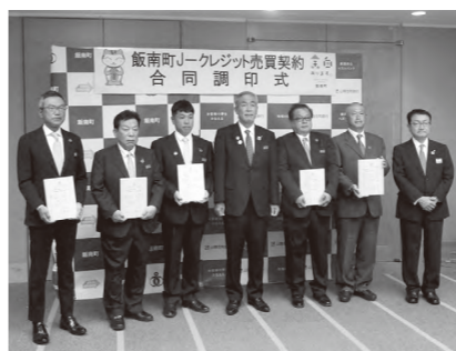
今後もJ-クレジットの販売をとおして、森林整備を進めていきます

本町では、町有林で行う間伐により整備された二酸化炭素吸収量をクレジット化し、企業・団体へ販売を行っています。 6月に初の売買契約を締結しましたが、この度、山陰合同銀行からの仲介で、初の町内企業を含む県内5社から購入いただき、合同での売買契約調印式を行いました。 企業名※順不同 ・森島建設(株) ・(有)足立運送(出雲) ・(有)キムラプラン(松江) ・(株)第二総合警備(松江) ・マシン・テクノロジー(株)(松江)