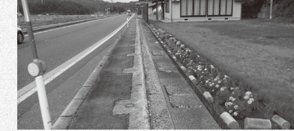
下赤名東下会館前