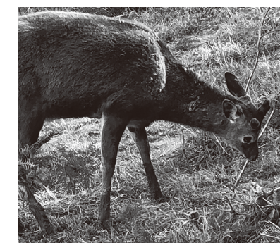
スギ植栽木を食害するニホンジカ

被害を防ぐためには、防護柵などの設置による侵入防止と捕獲を、効果的に組み合わせることが必要です。例えば、田畑ではイノシシ対策用のワイヤーメッシュ柵の上部に、電気柵を設置する複合柵が、造林地では、積雪を踏まえて、耐雪用支柱を用いたネット柵が設置されています。シカが増えて被害が大きくなるように、捕獲技術の確立とともに、飯南町を含めた中国山地の市町における捕獲体制づくりが求められます。