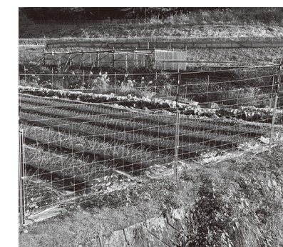
金網柵と電気柵を組み合わせた複合柵