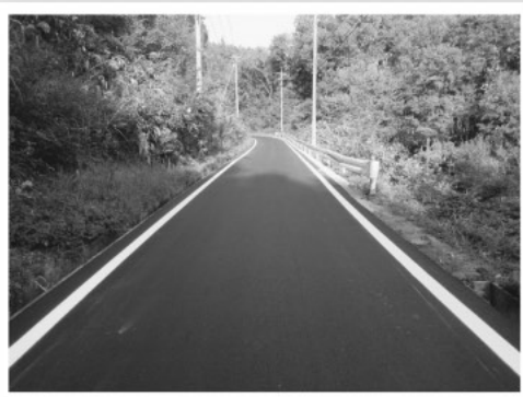
舗装がきれいになった「町道上の谷光峠線」

今年度の交付金額は625万5千円で、今後もこの交付金事業を活用し、地域の施設整備等を行う予定です。