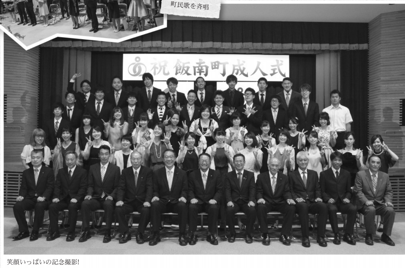
笑顔いっぱい記念撮影!