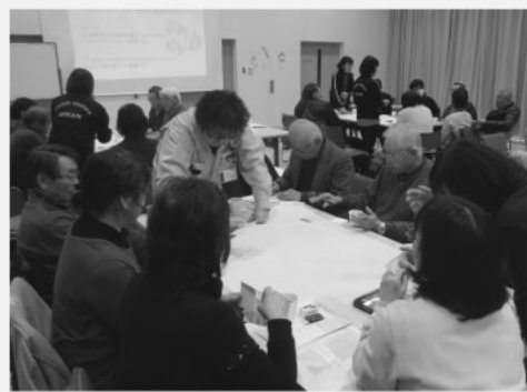
意見交換会 町内4カ所で開催し77名の町民の皆さんが参加