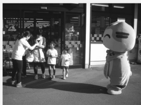
禁煙・脳卒中予防 街頭キャンペーン